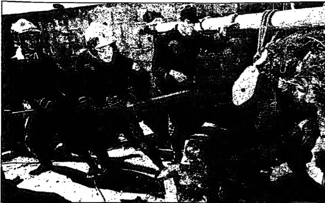
صال انقلاب ياسر عرفات تتشكك وتطالب بجزائريين قتلهم في جزيرتين، وترجم الرئيس اليرباني إلى مأسسة الجبهة الإسلامية المسلحة لقتل قسديا في ذلك الجو